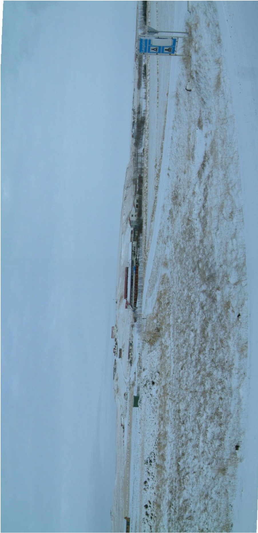
Mynd 4. Laugaland í Holtum.