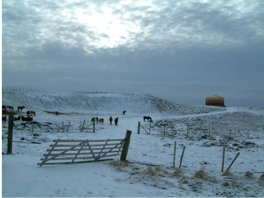
Mynd 6. Miðlunartankurinn fyrir ofan Laugaland.