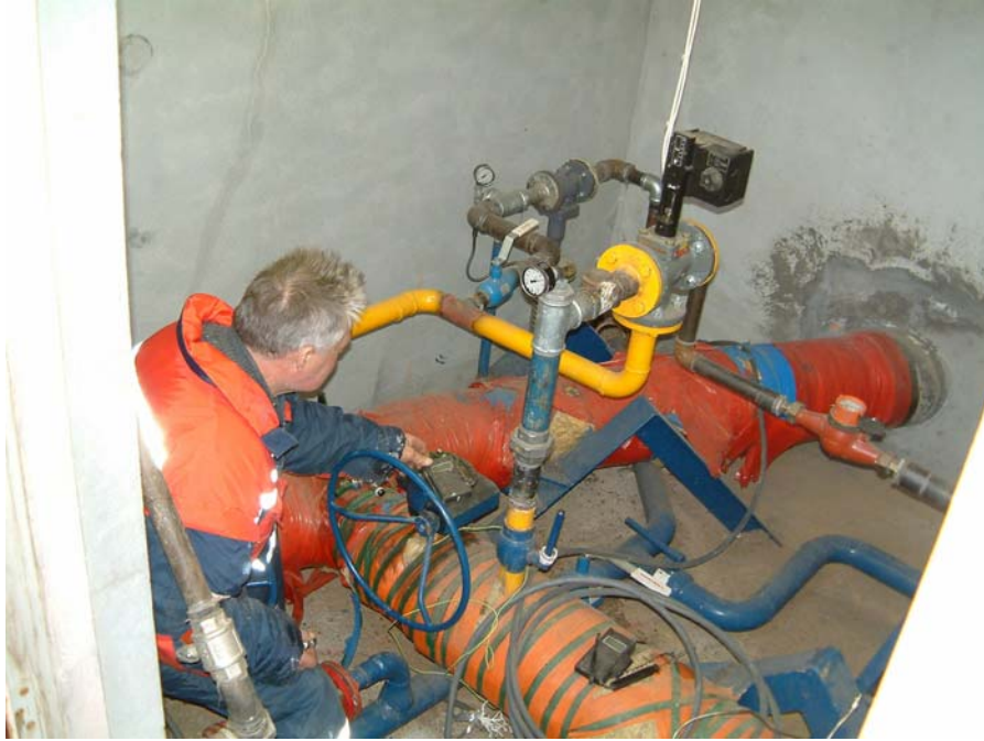
Mynd 8. Aðstæður við brunn 23, Ytri Rangá.