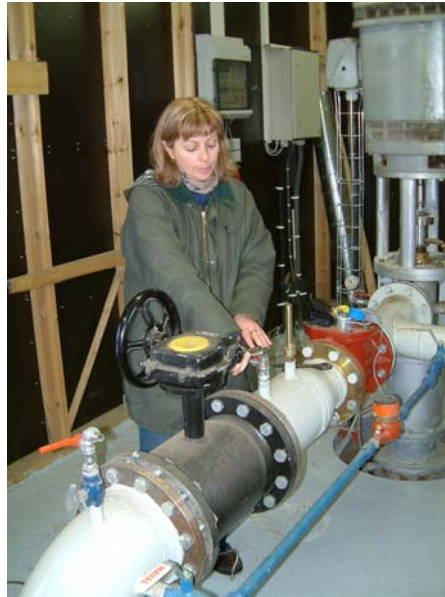
Mynd 2. Starfsmaður ROS að tengja sýnatökubúnað við KH-36.