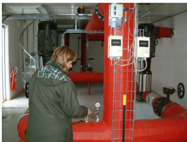
Myndir 3a og b. Starfsmaður ROS að tengja súrefnismælitæki í miðlunartanki.