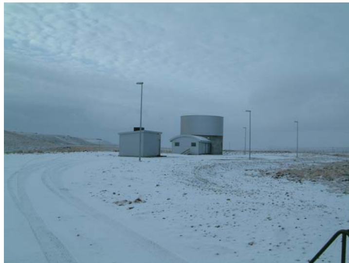
Mynd 1. Kaldárholt, hola KH-36 og miðlunartankur, hitaveita Rangæinga