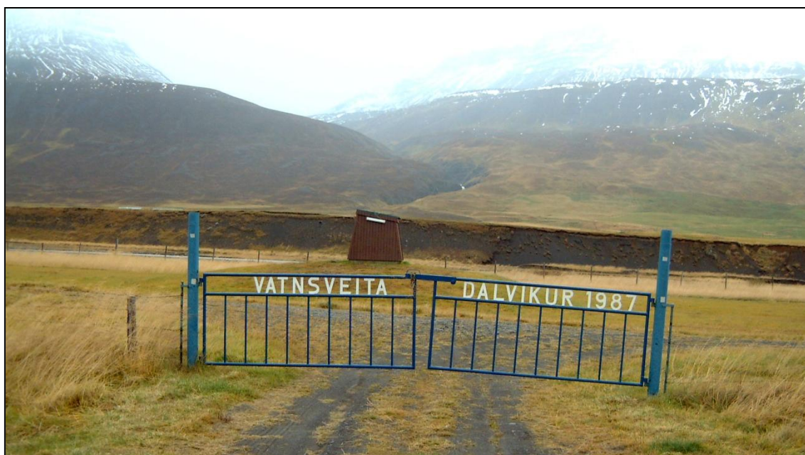
Mynd 4. Hér eru brunnar grafnir í ármöl.