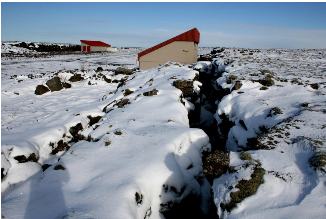
Mynd 3. Vatnsból í Lágum nálægt Svartsengi. Vatninu er dælt úr gapandi gjám.